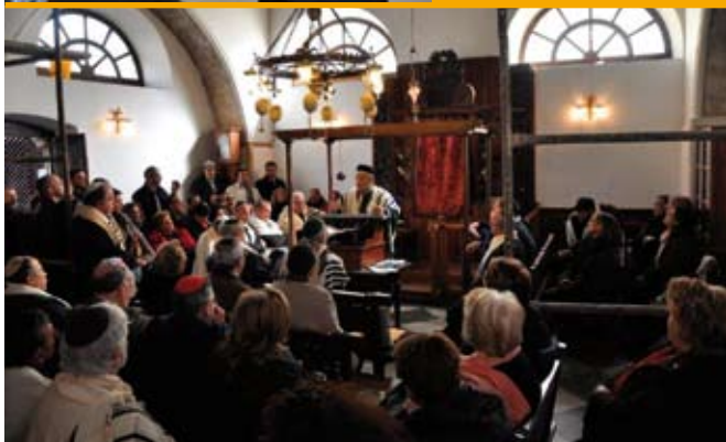
Κάτω: Από τη λειτουργία στη Συναγωγή.