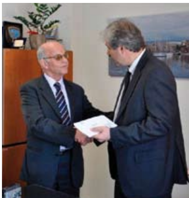
Αριστερά: Επίδοση του Ψηφίσματος στον Αντιδήμαρχο Χανίων.